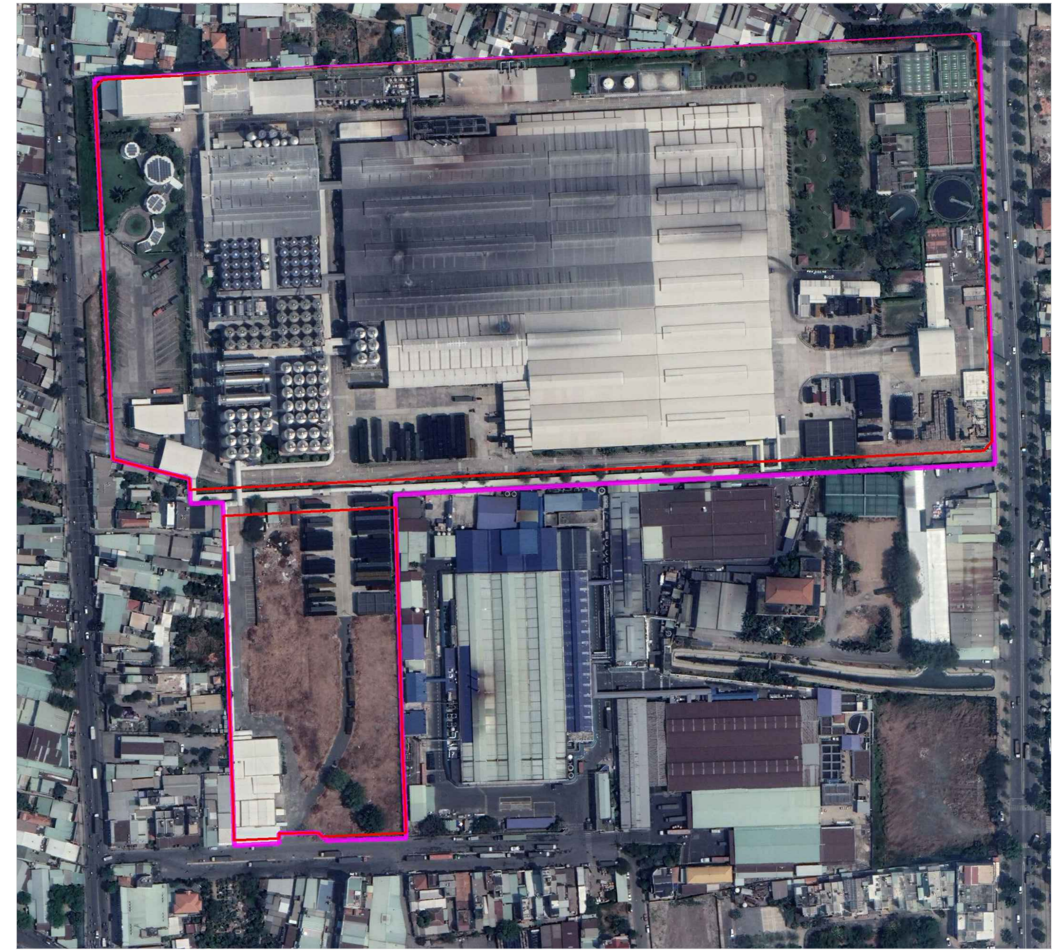
KHÔNG ẢNH KHU VỰC LẬP QUY HOẠCH